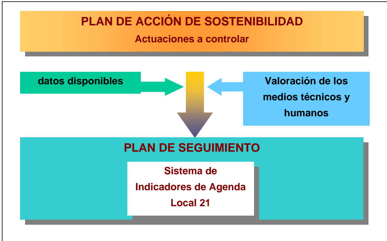
Estructura del Plan de Seguimiento