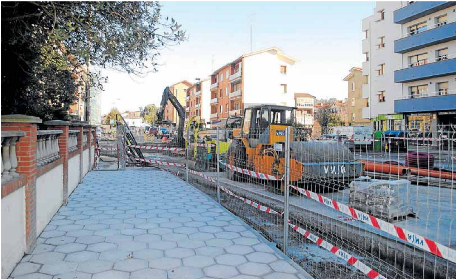
Las dos fases de la obra se solaparán para reducir las molestias. La accesibilidad de la calle mejorará y será más amable para los peatones.

La accesibilidad mejorará adaptándose a la ley existente y se incorporarán pequeñas zonas verdes y de arbolado para garantizar un