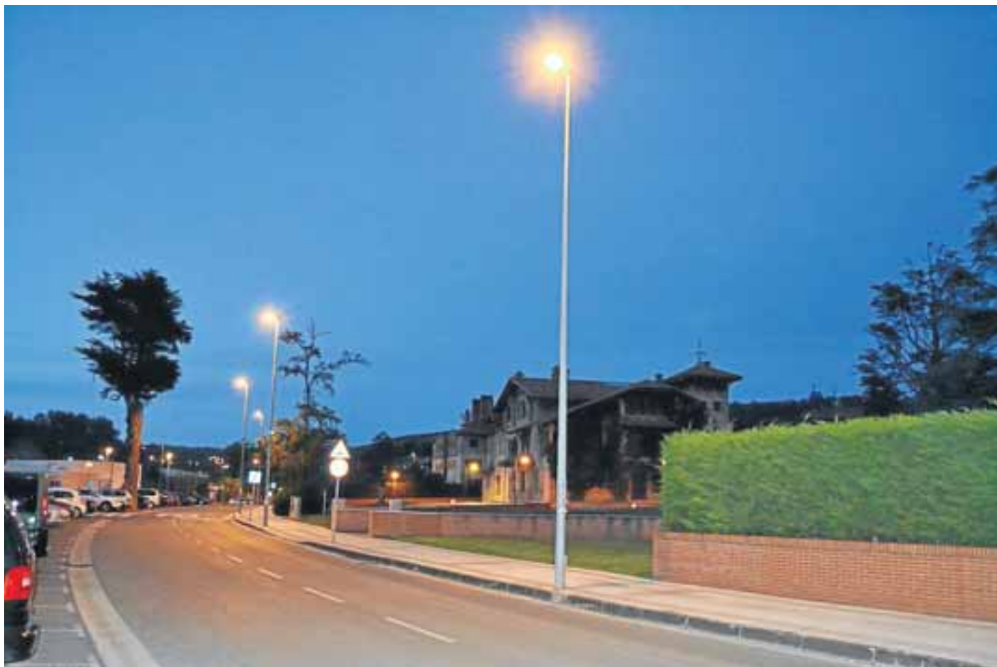
Iluminación nocturna en el entorno del parque Moreaga.