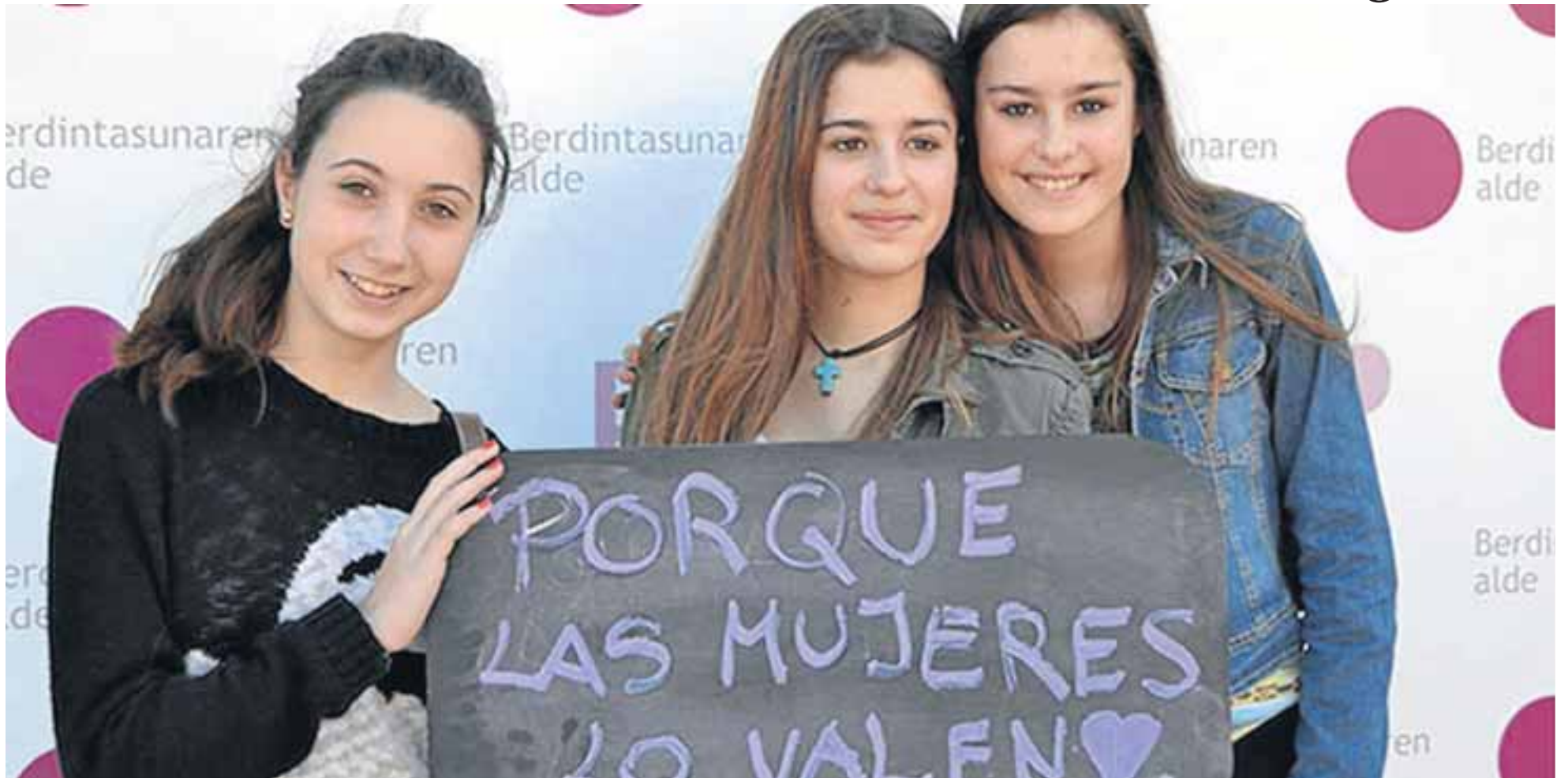
Photocall con un mensaje por la igualdad.