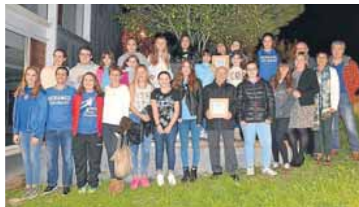
Imagen de los premiados en la gala Hemendik.