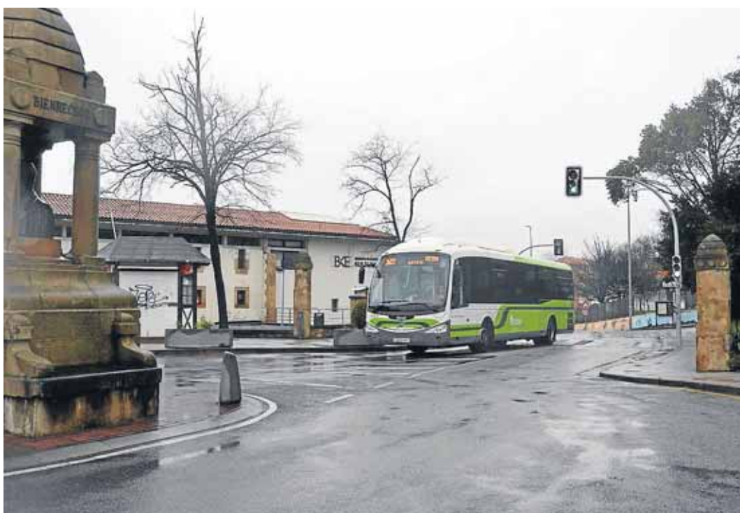
“Eskolara oinez” invita a ir andando de casa al colegio.

CUBIERTA EN MOREAGA Por otra parte, ya se ha abierto el concurso de ideas para colocar una cubierta en la plaza de Moreaga, donde recientemente se han renovado los juegos infantiles y se han colocado nuevos aparatos de última generación. El proceso incluirá la participación ciudadana y se admitirán las propuestas realizadas por las empresas presentadas a concurso. Se trata de colocar una cubierta de policarbonato transparente que proteja de las inclemencias climatológicas, y que a la vez deje pasar la luz.