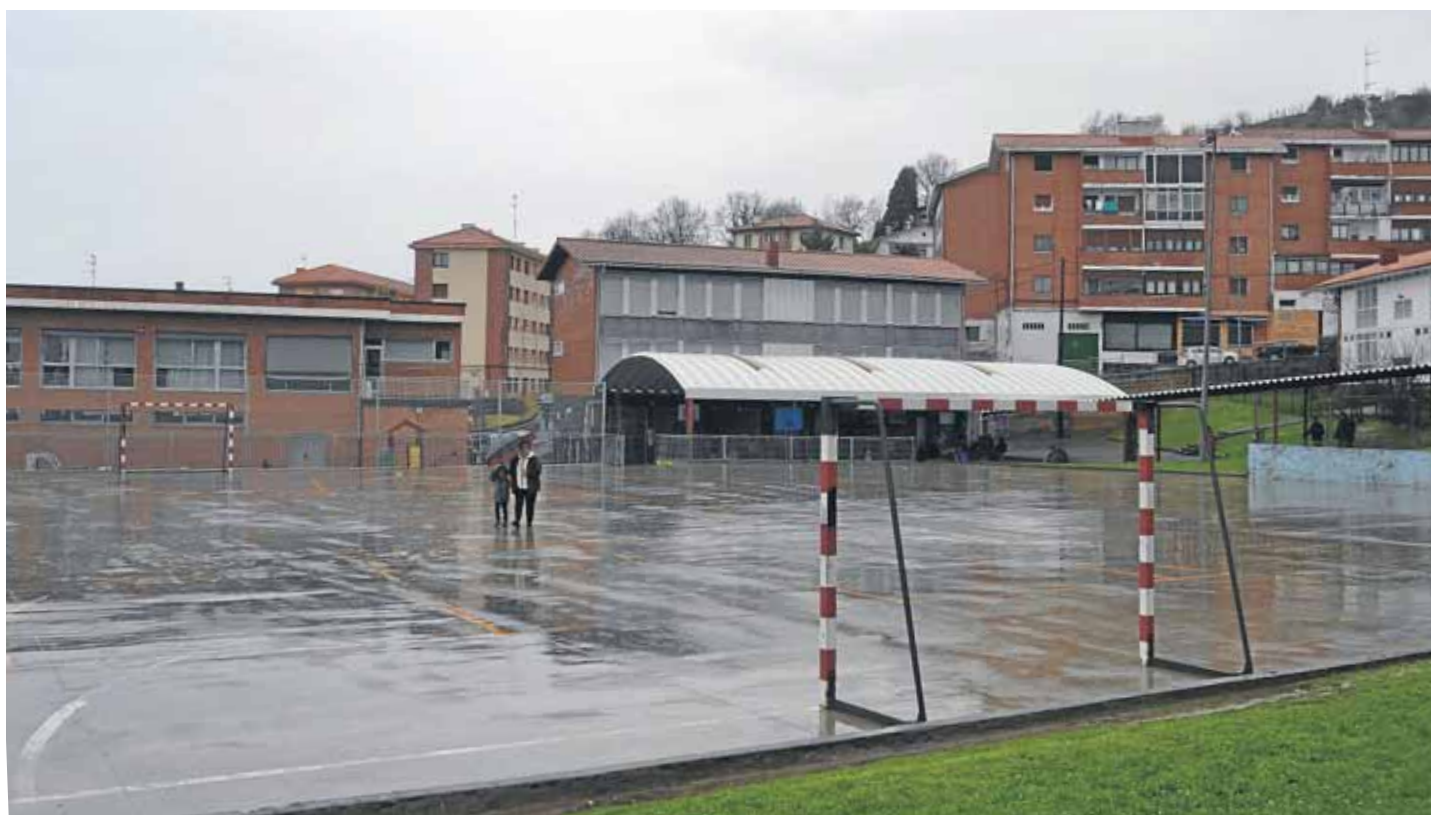
La cubierta permitirá realizar actividades fuera, cuando llueve.