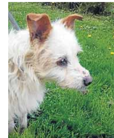
Nombre: Lolo Raza: Mestizo Sexo: Macho, castrado Edad: 2 años Tamaño: Pequeño Características: Sociable