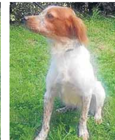
Nombre: Spike Raza: Spaniel Bretón Sexo: Macho Edad: 3 años Características: Sociable con perros y personas