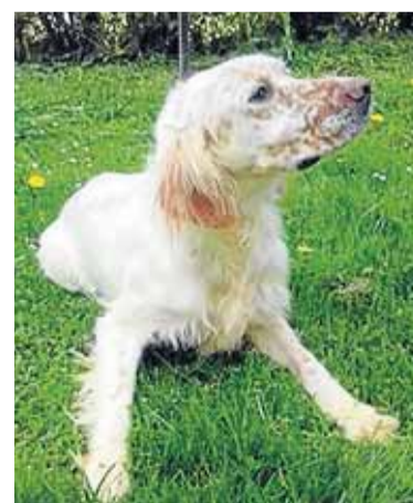
Izena: Tak Arraza: Setter Sexua: Arra Adina: 3 urte Ezaugarriak: Lagunkoia, baina aktibitatea behar du