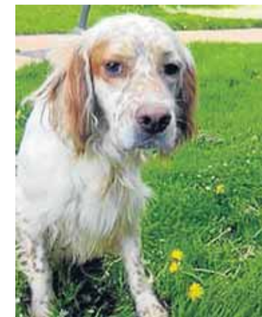
Nombre: Saiko Raza: Setter Sexo: Macho Edad: 2 años Características: Sociable y activo