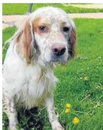
Izena: Saiko Arraza: Setter Sexua: Arra Adina: 2 urte Ezaugarriak: Lagunkoia eta aktiboa

Ba al dakizu, gaur egun, Berangoko herrian bertan batu diren 5 txakur daudela txakurtegian, adopzioaren zain? Interesaturik egonez gero, ikustera joan zaitezke, ZAUNK -era