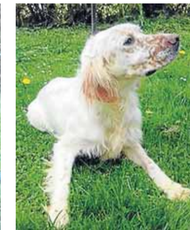
Nombre: Tak Raza: Setter Sexo: Macho Edad: 3 años Características: Sociable pero necesita actividad