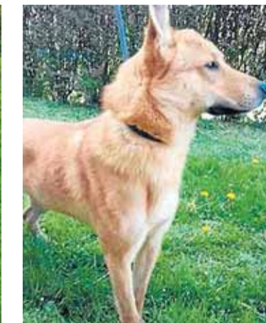
Nombre: Ron Raza: Mestizo Sexo: Macho Edad: 2,5 años Características: Sociable y cariñoso