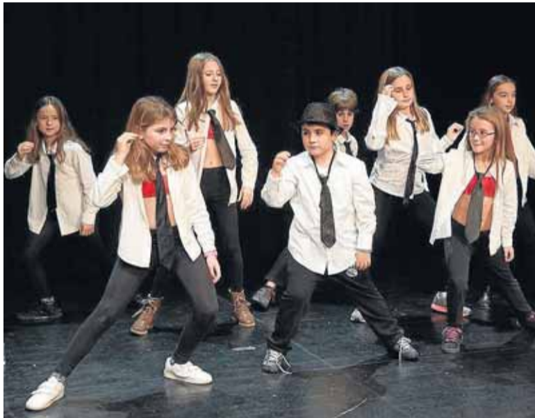
La Milla de Berango tiene un nivel sobresaliente.

La Asociación de la Mujer, el coro y grupo de bailes de salón de la Asociación de Jubilados, el coro de la parroquia, la Escuela de Música, el grupo de baile moderno del taller de la Kultur Etxea y ACADAE -Asociación Cultural de Amigos de las Artes Escénicas- fueron los protagonistas del espectáculo programado con motivo del aniversario del Berango Antzokia. Durante otra edición más, ACADAE coordinó este montaje que agradó al público asistente y ofreció a estos colectivos la oportunidad de exhibir su trabajo. Todas las personas asistentes brindaron una cerrada ovación a la gran labor de estas agrupaciones que tanto contribuyen a fomentar la vida cultural de Berango.