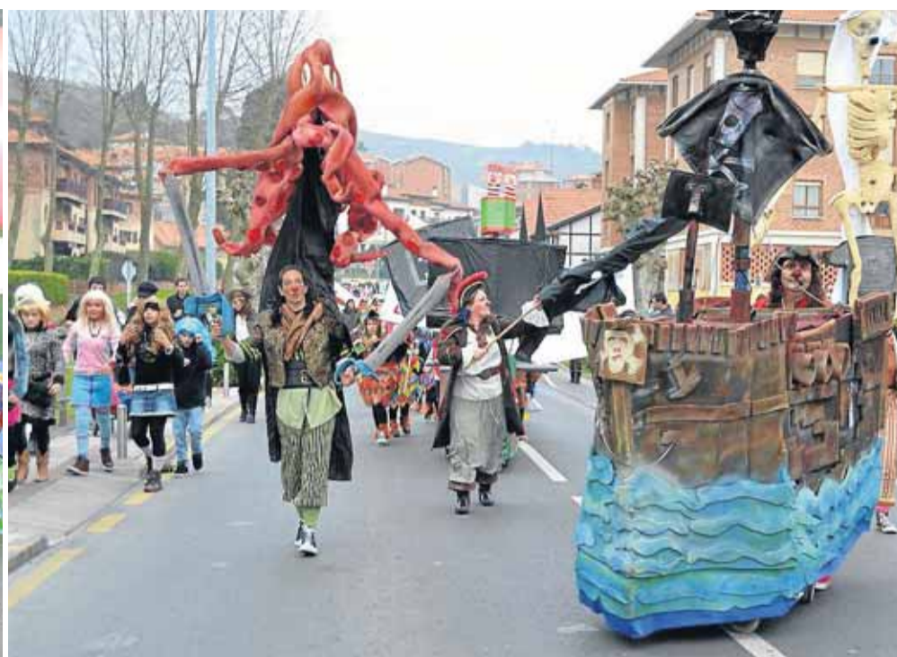
Numeroso público disfrutó disfrazado de la fiesta. Animación en la bajada de los Carnavales de 2014.