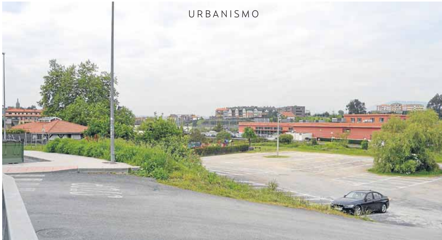
Vista general del área industrial.