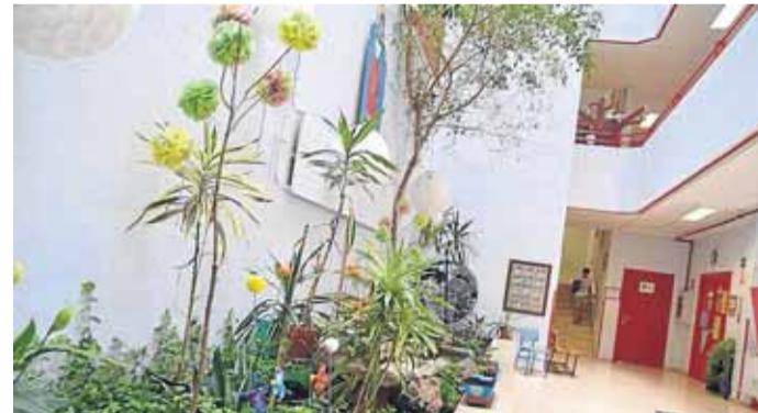
Imagen del interior del Colegio Berango-Merana.

"Actívate+" impulsa entre la población la puesta en práctica de pequeñas acciones cotidianas encaminadas a mejorar la salud ambiental del planeta, además de obtener un beneficio personal. La idea nace de Global Action Plan (GAP), una ONG que pertenece a