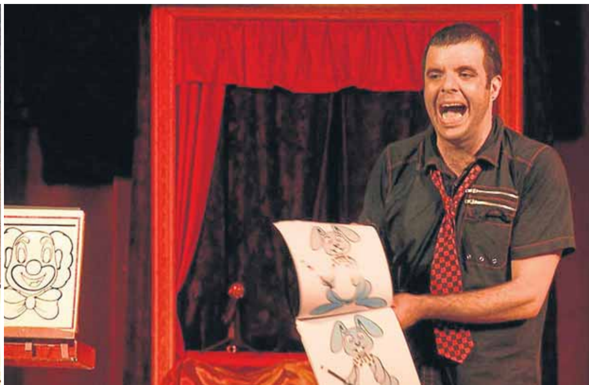
La actividad se multiplica en en Berango Antzokia por Navidad.