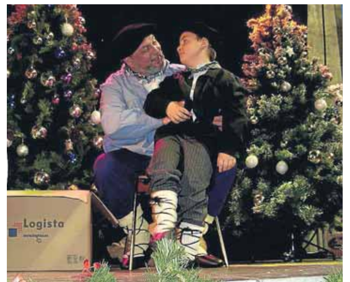
Olentzero ofrecerá la recepción en el frontón.

La Cabalgata inundará de color las calles el 5 de enero. Saldrá a las siete y media de la tarde desde el mismo punto, el Aula de Berangoeta. Los Magos de Oriente irán a caballo con su séquito, acompañados de sus pajes y con la legión romana al frente. La recepción también tendrá lugar en el frontón, donde repartirán golosinas entre las niñas y los niños que acudan a pedirles sus regalos.