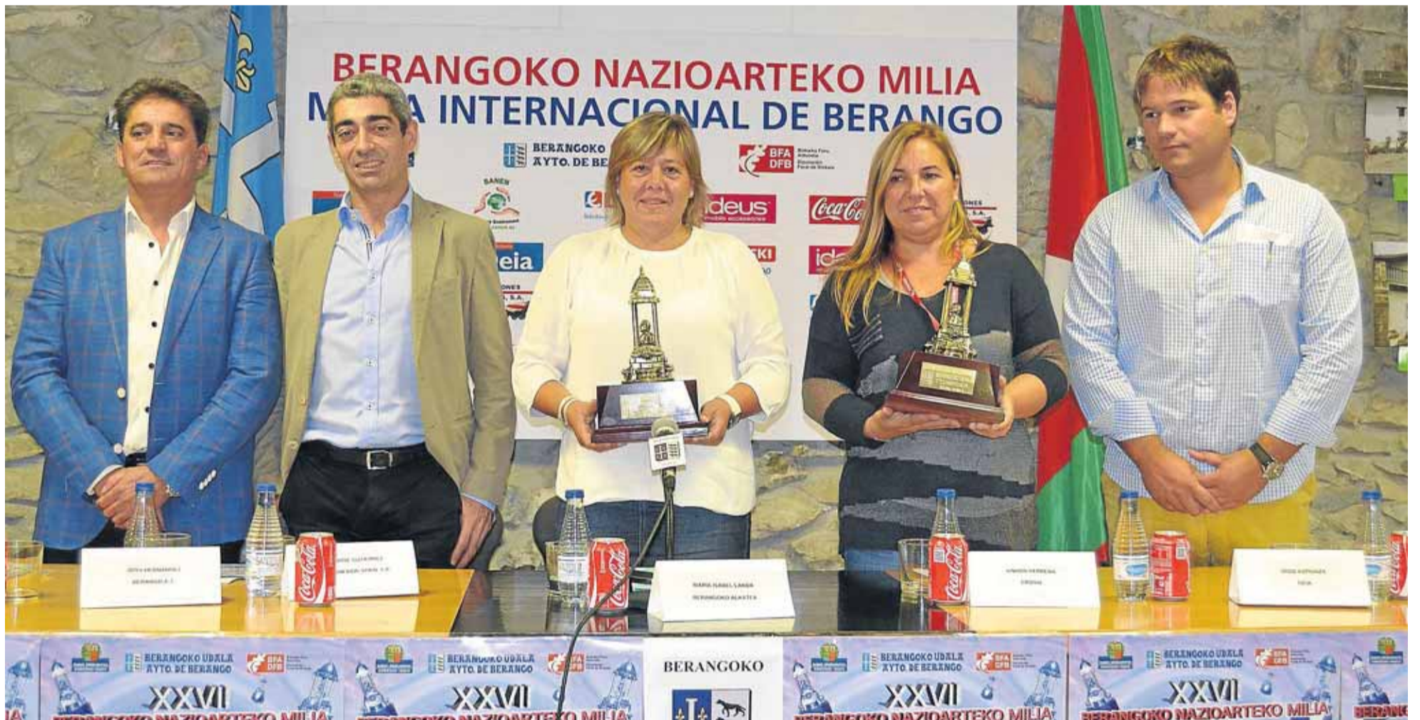
La Milla de Berango tiene un nivel sobresaliente.

alta, la Milla Internacional de Berango seguirá ocupando todavía el segundo puesto del ranking nacional de este tipo de pruebas. Eso se debe a que es obligado ocupar durante tres años el primer puesto para pasar a ser considerada como la mejor prueba del Estado. La Federación Española valora varios conceptos en su baremación y entre ellos se saca una media de la puntuación de las tres últimas ediciones, nivel de los atletas, antigüedad de la prueba, número de participantes y que se cumpla la normativa existente para este tipo de competiciones.