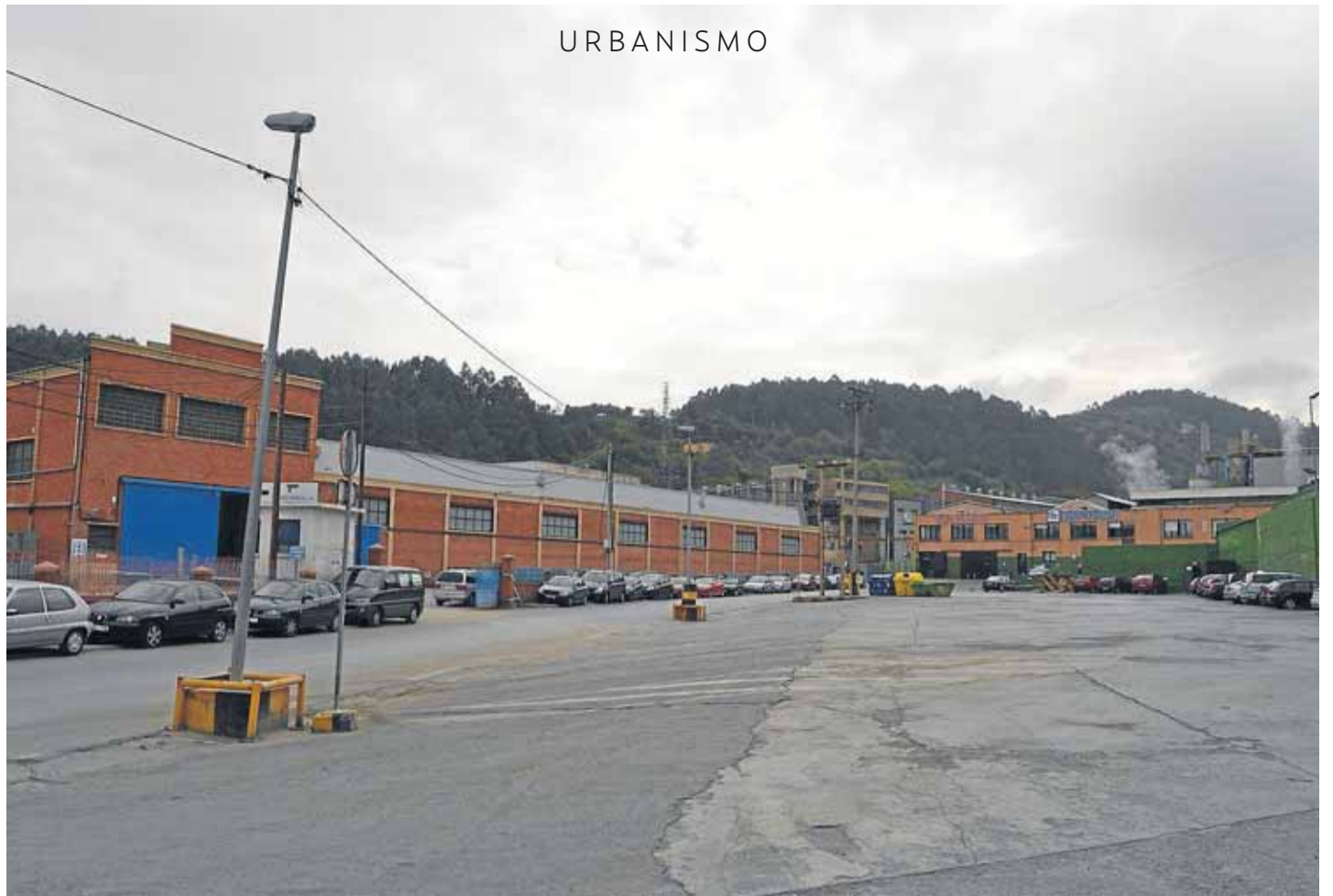
Imagen del área industrial de Berango.