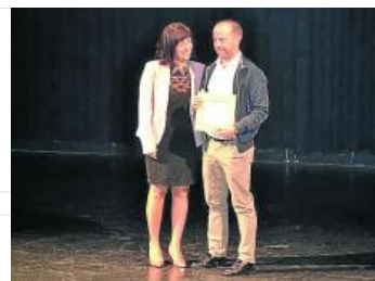
Un Hemendik para Joyería Iñaki.