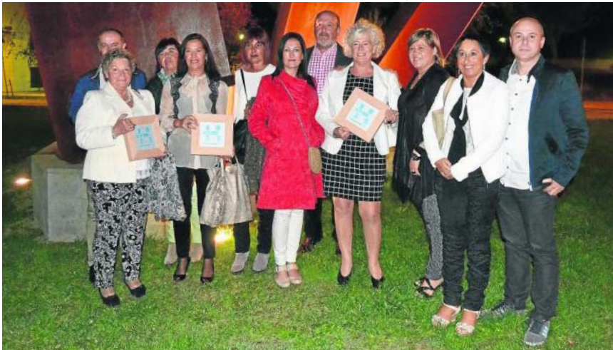
Todos los premiados posan en Urduliz.