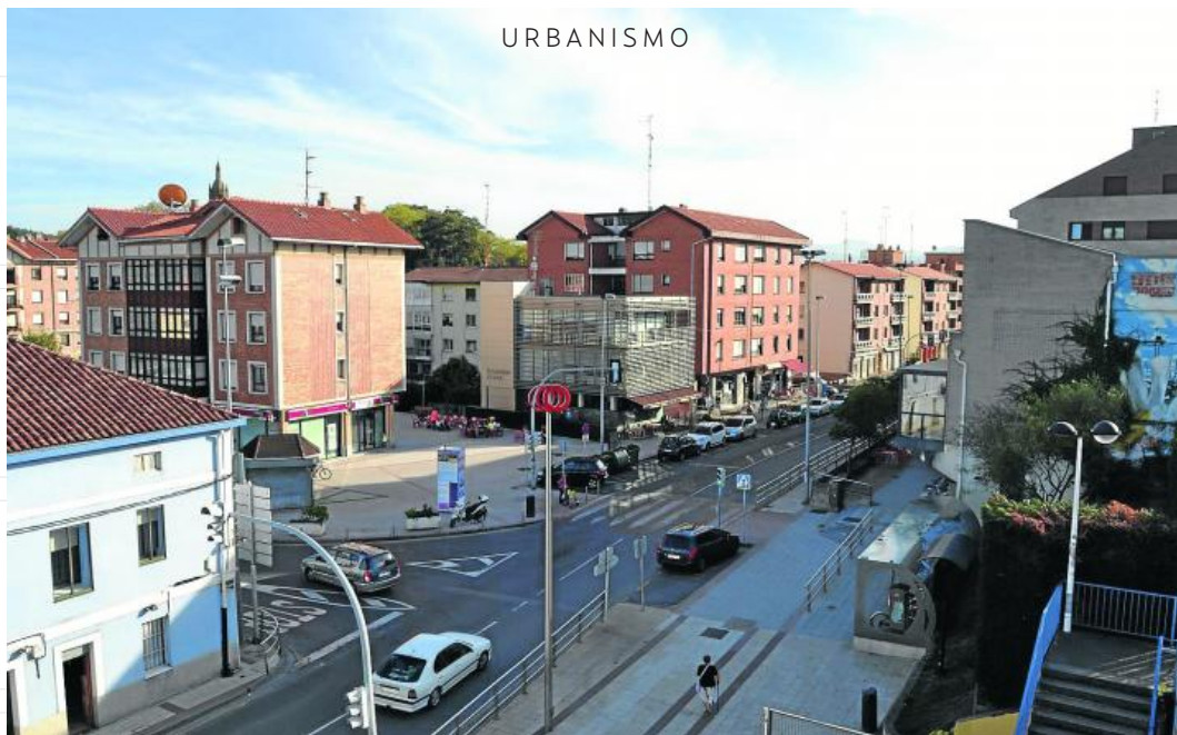
Imagen de la calle Sabino Arana.