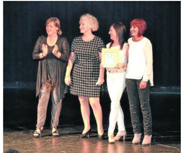
Galardón a Eroski por sus 25 años.